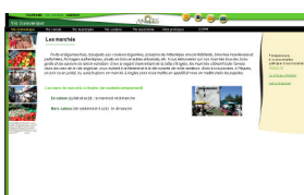
Rubrique Vie Locale

Commerces, artisans, vie municipale, associative, sociale, etc. toutes les informations pratiques de la commune d'Angles sont présentées dans la rubrique Vie Locale. Les résidents peuvent notamment écrire directement à M. le Maire ou consulter en ligne chaque mois le compte-rendu du Conseil Municipal.