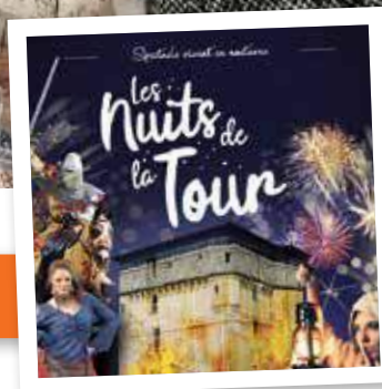
Page 13 : Les Nuits de la Tour