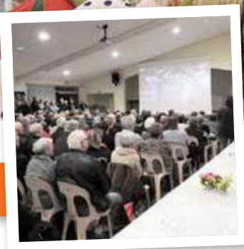
Page 3 : Vœux du Maire