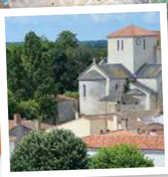
Page 4 : Guide Pratique 2020