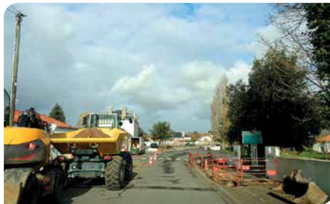
Table Clos Cottet

Un espace adapté aux fauteuils roulants et équipé d'une table pouvant recevoir un fauteuil a été implanté sur l'espace vert du Clos Cottet, route de La Tranche-sur-Mer. Un cheminement a été réalisé pour en faciliter l'accès, tout en considérant l'éloignement du lieu de stationnement. ■