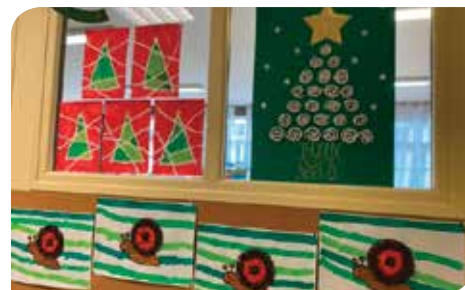
Projet classe de MS/GS autour des escargots.

Impossible cette année pour les enseignantes de maintenir le spectacle de Noël. Qu'à cela ne tienne, c'est l'école toute entière qui s'est parée de ses plus beaux atouts.