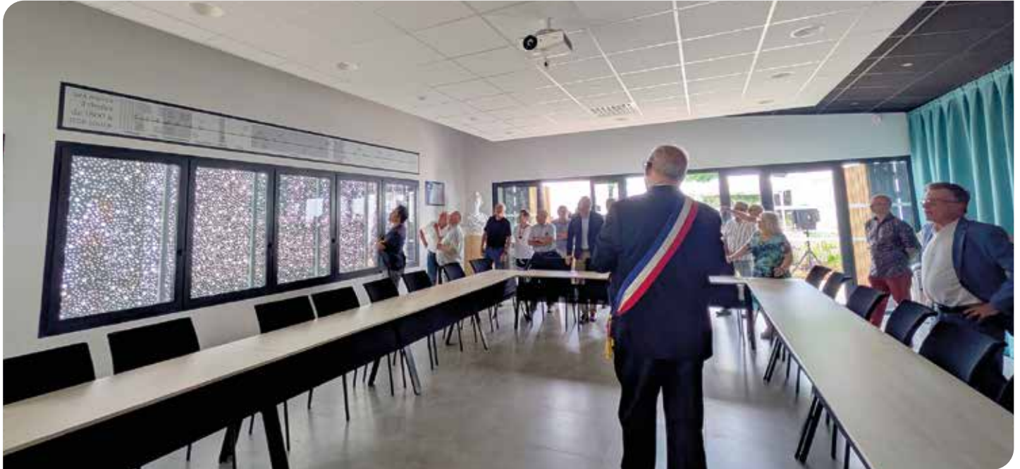
Visite de la mairie - Salle du Conseil municipal et des mariages