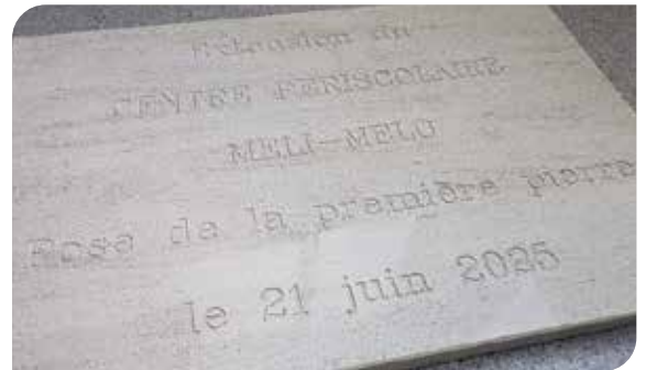
Plaque inaugurale du centre périscolaire

de rénovation comprenait : l'achat de la maison abritant aujourd'hui la Police Municipale, les travaux d'installation dans ces nouveaux locaux, la création de l'extension de la mairie, la rénovation partielle de la mairie historique, l'achat de nouveau mobilier là où il était nécessaire et la mise à niveau du système d'alarme. Le coût total de cette opération est de 1 030 301, 99 TTC euros TTC. Pour l'extension, l'opération a été financée par une DETR, un fonds de concours Vendée Grand Littoral, une récupération de TVA et un autofinancement de 595 898,24 € sans recours à l'emprunt. Cette matinée a également été consacrée à l'extension du centre périscolaire avec la révélation de la plaque installée à son fronton, marquant la pose de la première pierre. ■