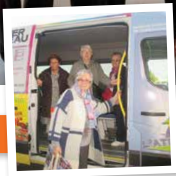
Page 7 : Minibus...1 an après !