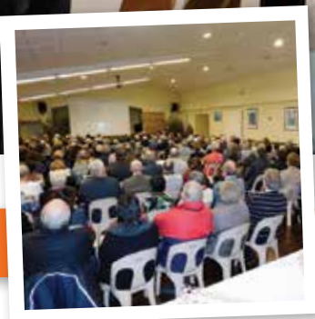
Page 3 : Vœux du Maire