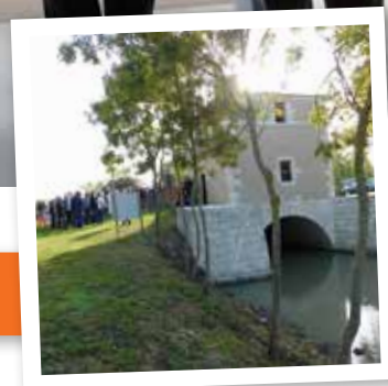
Page 8 : Restauration de l'Octroi