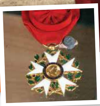
Page 7 : Médaille d'Officier de la Légion d'Honneur