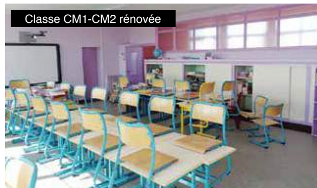
Classe CM1-CM2 rénovée