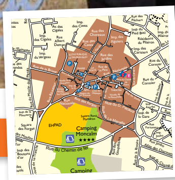
Page 3 : PLU