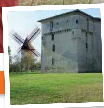
Page 8 : Les Nuits de la Tour