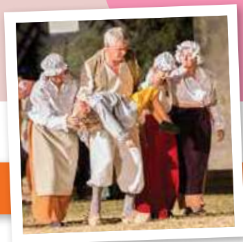
Pages 10 et 11: Dossier : Retour sur Les Nuits de la Tour