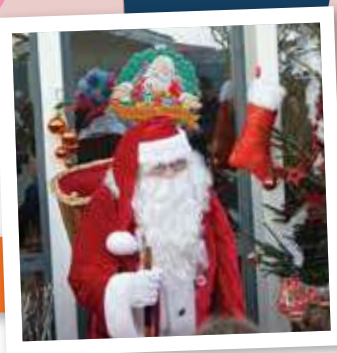
Page 13 : Marché de Noël