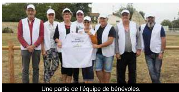
Une partie de l'équipe de bénévoles.