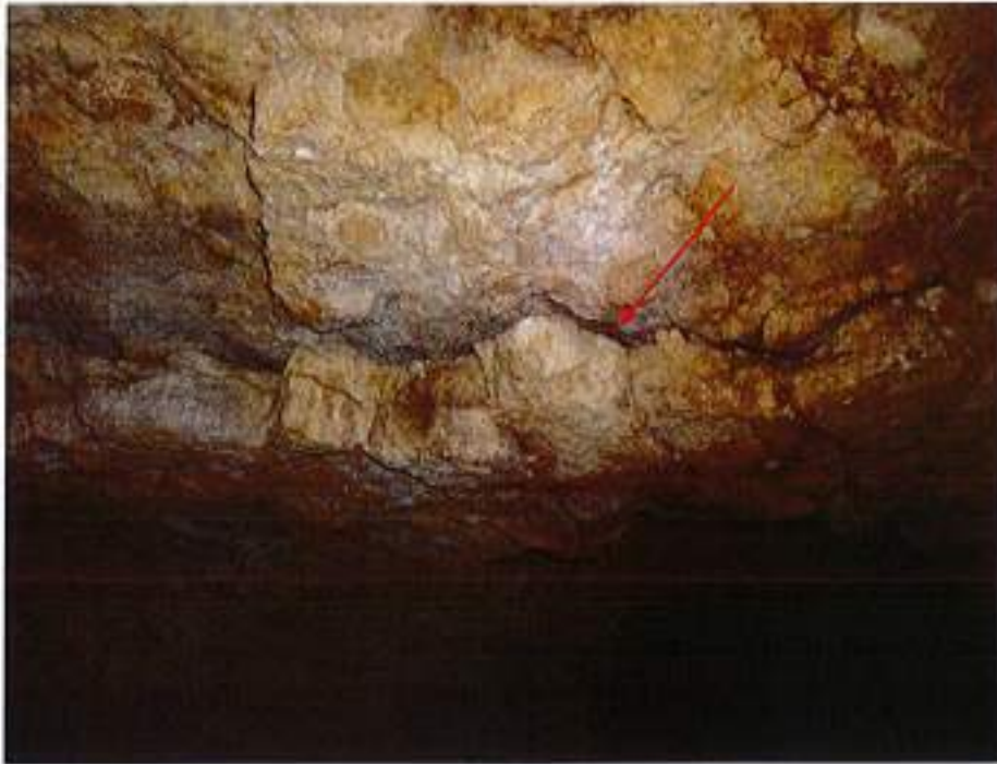
Illustration 5 : écaille partiellement désolidarisée, au toit de la cavité du site 2.