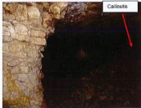
Illustration 6 : vues générales de la cavité