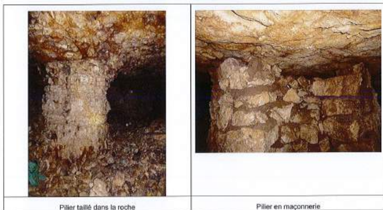
Illustration 8 : vues des deux piliers de la cavité