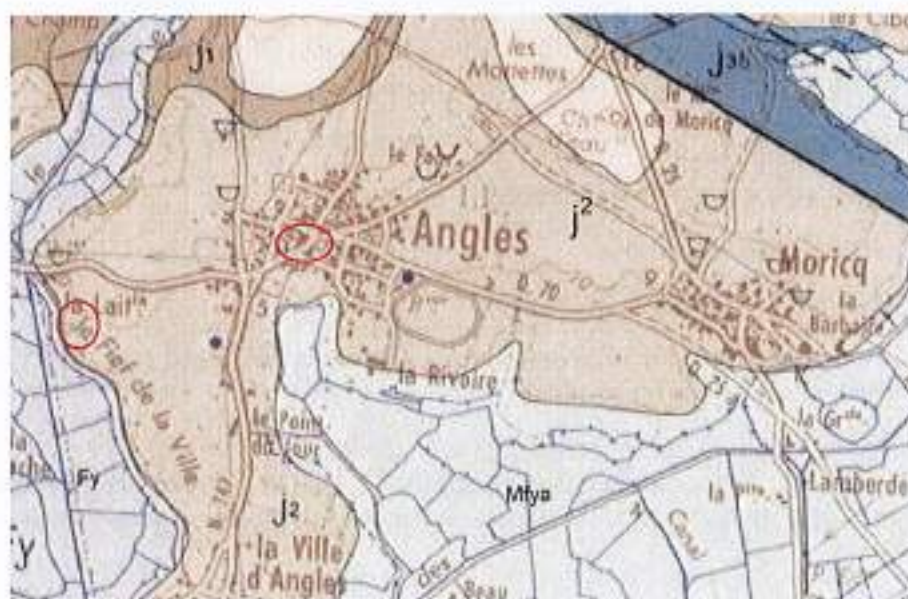
Illustration 2 : Contexte géologique