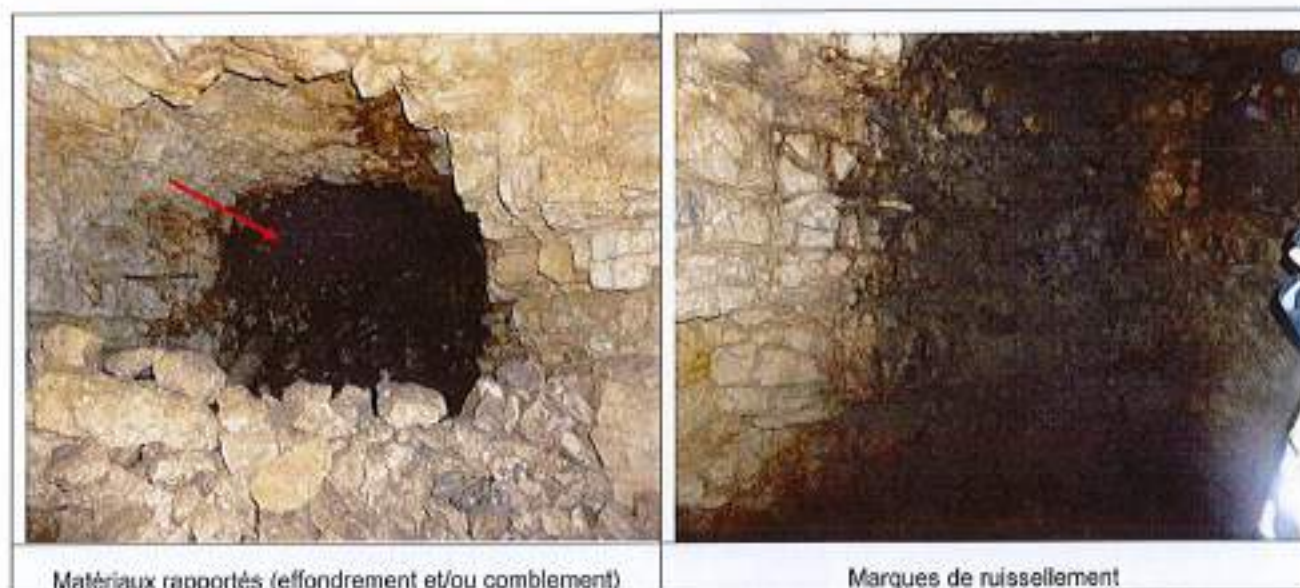
Illustration 7 : Vues de zones de la cavité à l'opposé du puits d'accès