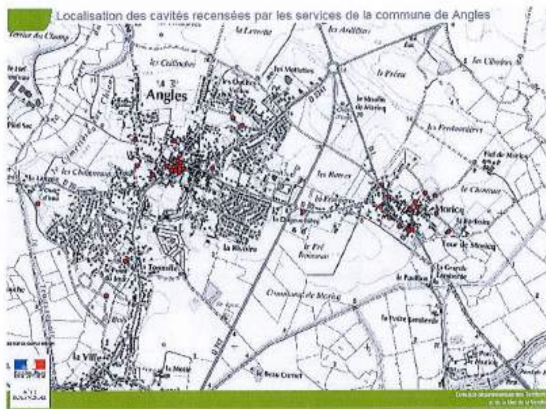
Illustration 1 : Localisation des cavités recensées par les services de la commune d'Angles (document DDTM 85)