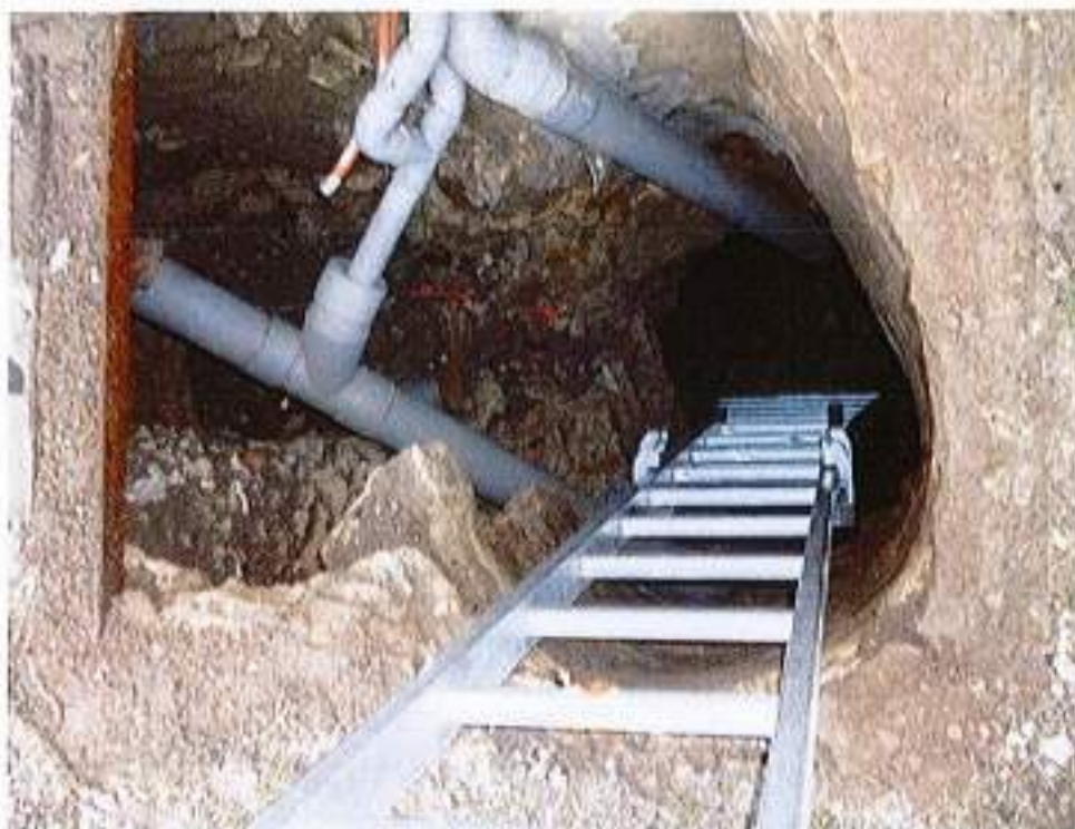
Illustration 4 : Puits d'accès à la cavité du site 2

La cavité se révèle assez conséquente, avec une forme complexe, et mesure globalement 11 m de long et environ 7 m de large. Comme mentionné au paragraphe « géologie », cette cavité est creusée dans du calcaire.