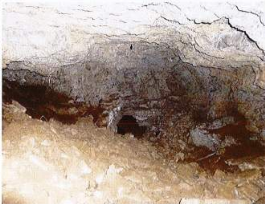
Illustration 9 : salle de la cavité (site 4) et boyau d'accès (au fond)

Lors de la visite, la présence d'un chiroptère a été observée. Dans une préoccupation de préservation de ces animaux, il conviendrait de veiller à ce que les accès à la cavité ne soient pas totalement obturés/comblés.