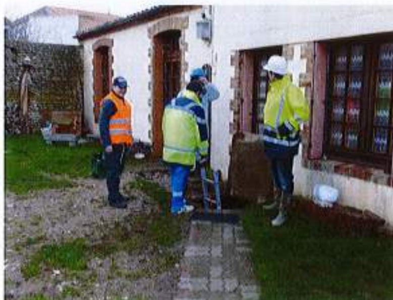
Illustration 3 : entrée de la cavité, au ras de l'habitation, site 2

L'accès à la cavité s'effectue par un petit puits vertical de diamètre métrique (cf. illustration 4). Ce puits permet d'estimer l'ordre de grandeur du recouvrement de la cavité, qui apparaît de l'ordre de 2m de calcaire.