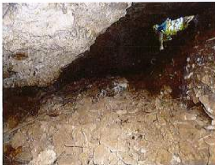
Illustration 10 : Un des accès latéraux, en partie remblayé (site 4)