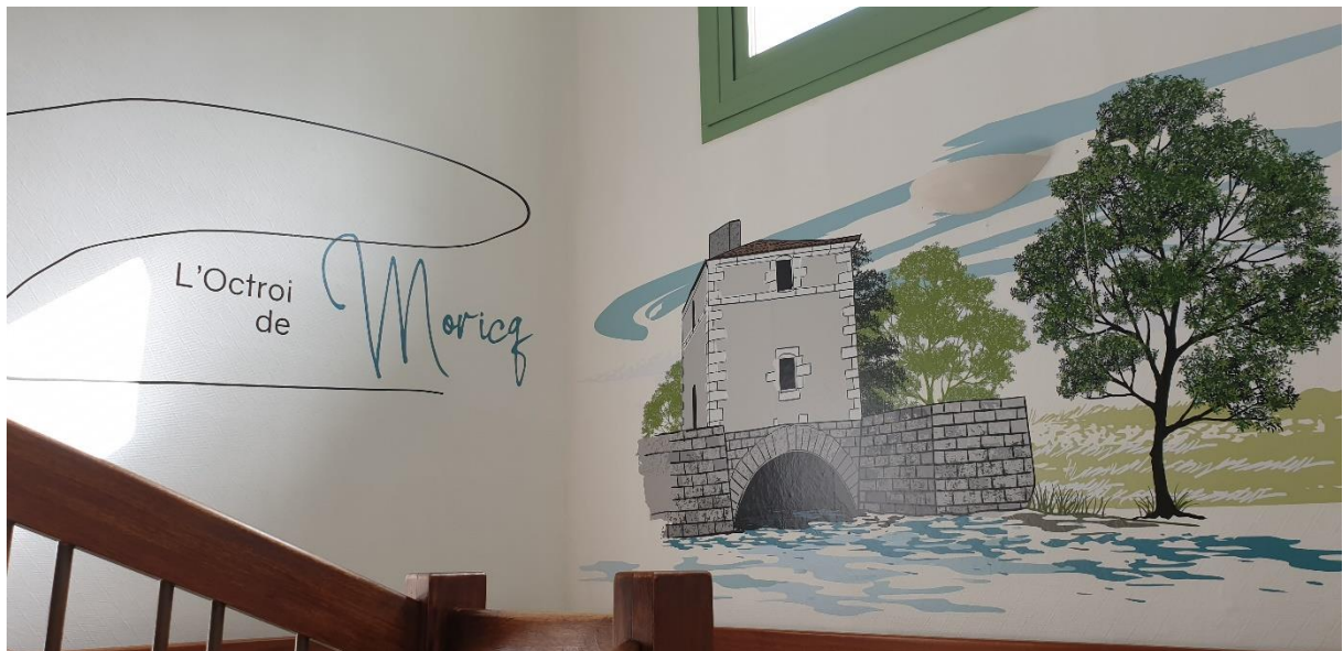
Palier de l'escalier