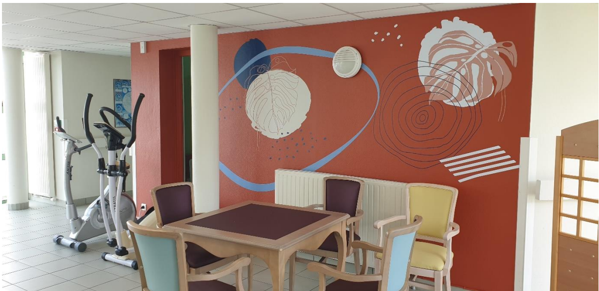
Salle de Kiné