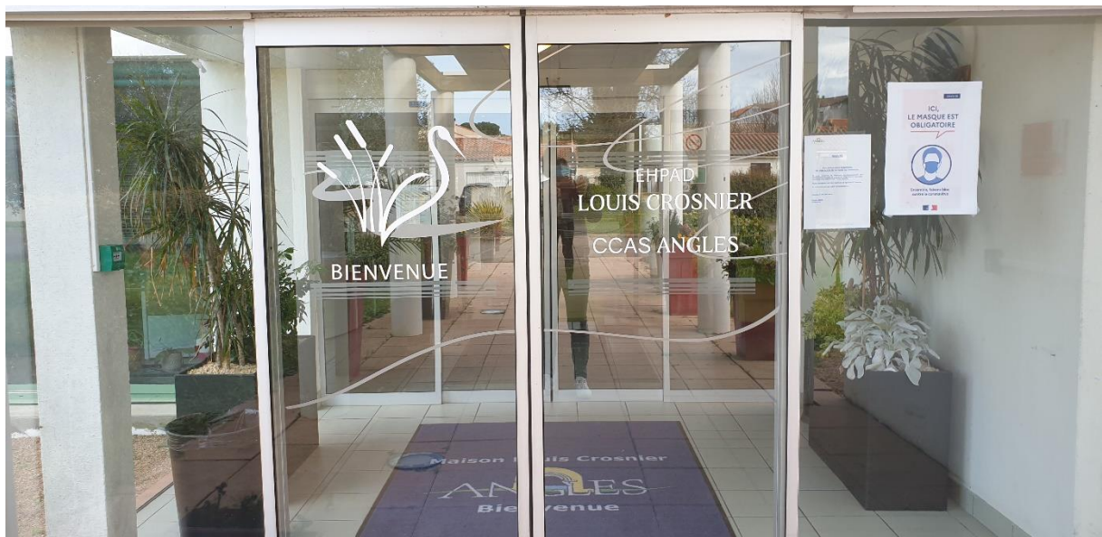
Porte d'entrée de la résidence