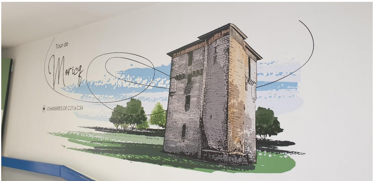
Entrée de couloir