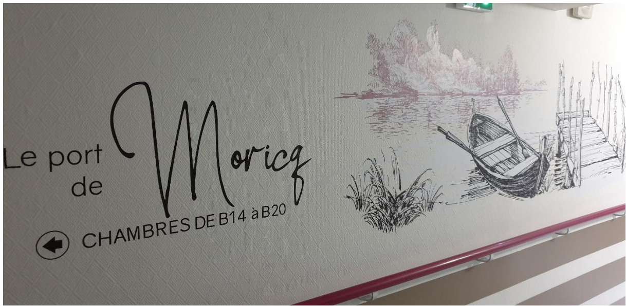
Entrée de couloir