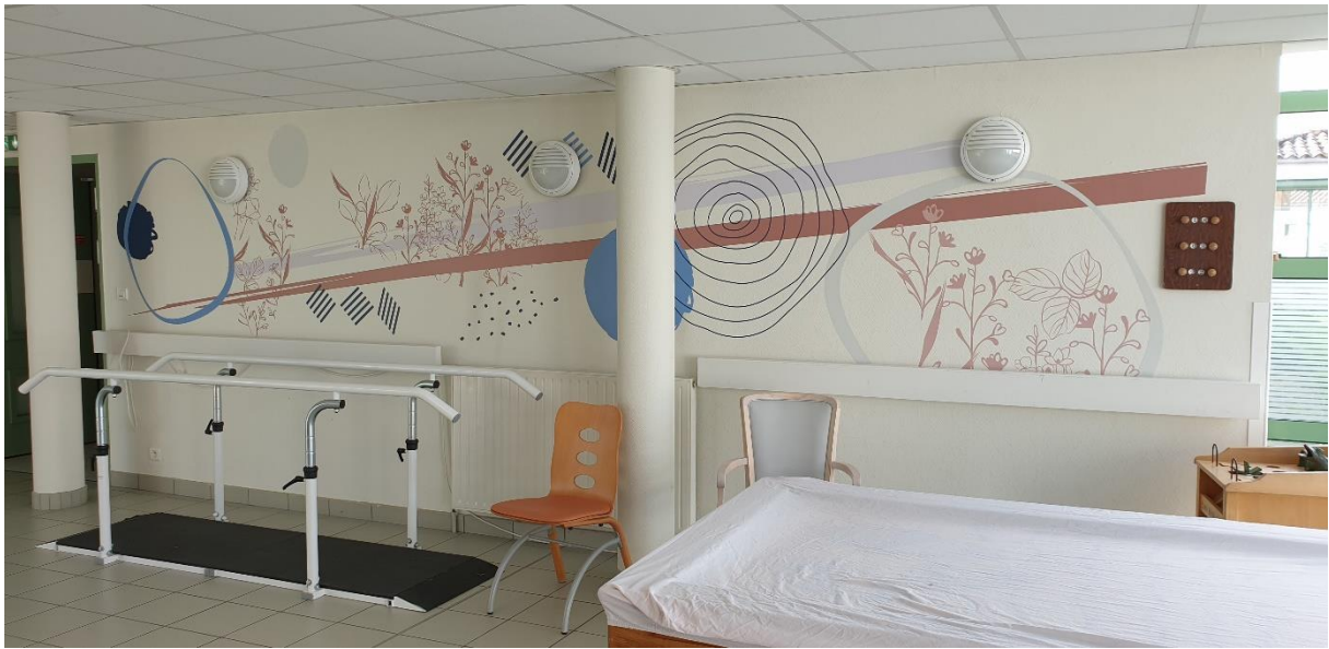
Salle de Kiné